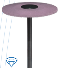
panther edition Linse/ lense 260 smooth Ø 26 x 2 mm ⊖ max. 8.000–20.000 min -1 1 St./ pc. REF 20721