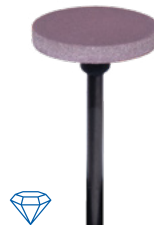
panther edition Rad/ wheel 170 smooth Ø 17 x 2,4 mm ⊖ max. 8.000–20.000 min -1 3 St./ pcs. REF 20722