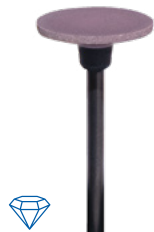
panther edition Rad/ wheel 150 smooth Ø 15 x 1 mm ⊖ max. 8.000–20.000 min -1 3 St./ pcs. REF 20723