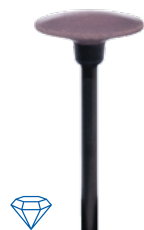
panther edition Linse/ lense 148 smooth Ø 15 mm ⊖ max. 8.000–20.000 min -1 3 St./ pcs. REF 20724