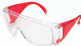
rot/ red REF 11782