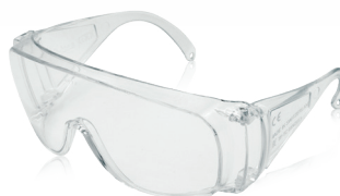
klar/ clear REF 11785