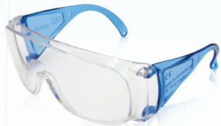
blau/ blue REF 11781