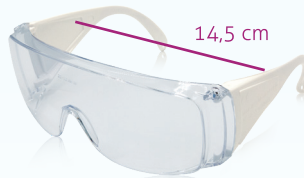
weiß/ white REF 11780

Für Korrekturbrillen bis 13,5 cm Breite for corrective glasses up to 13.5 cm