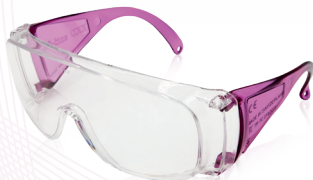
purpur/ purple REF 11783